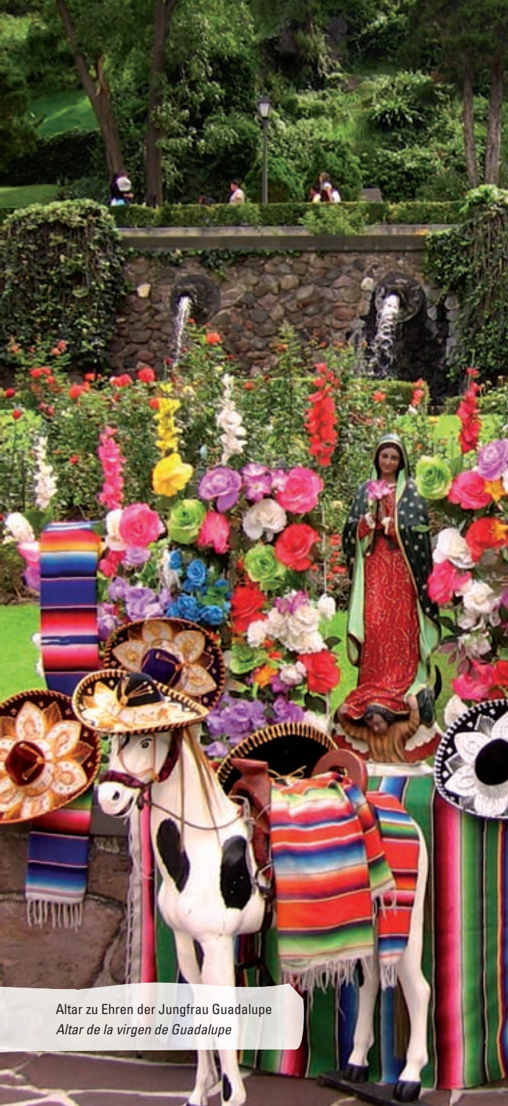
Altar zu Ehren der Jungfrau Guadalupe Altar de la virgen de Guadalupe